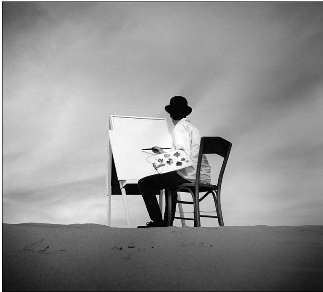
Beim Ausmalen der Berufsperspektive ist das Lehramt erste Wahl

Eine der Studentinnen, die sich an der Alanus-Hochschule auf den Lehrerberuf vorbereiten, ist Charlotte Trossbach. Sie hatte