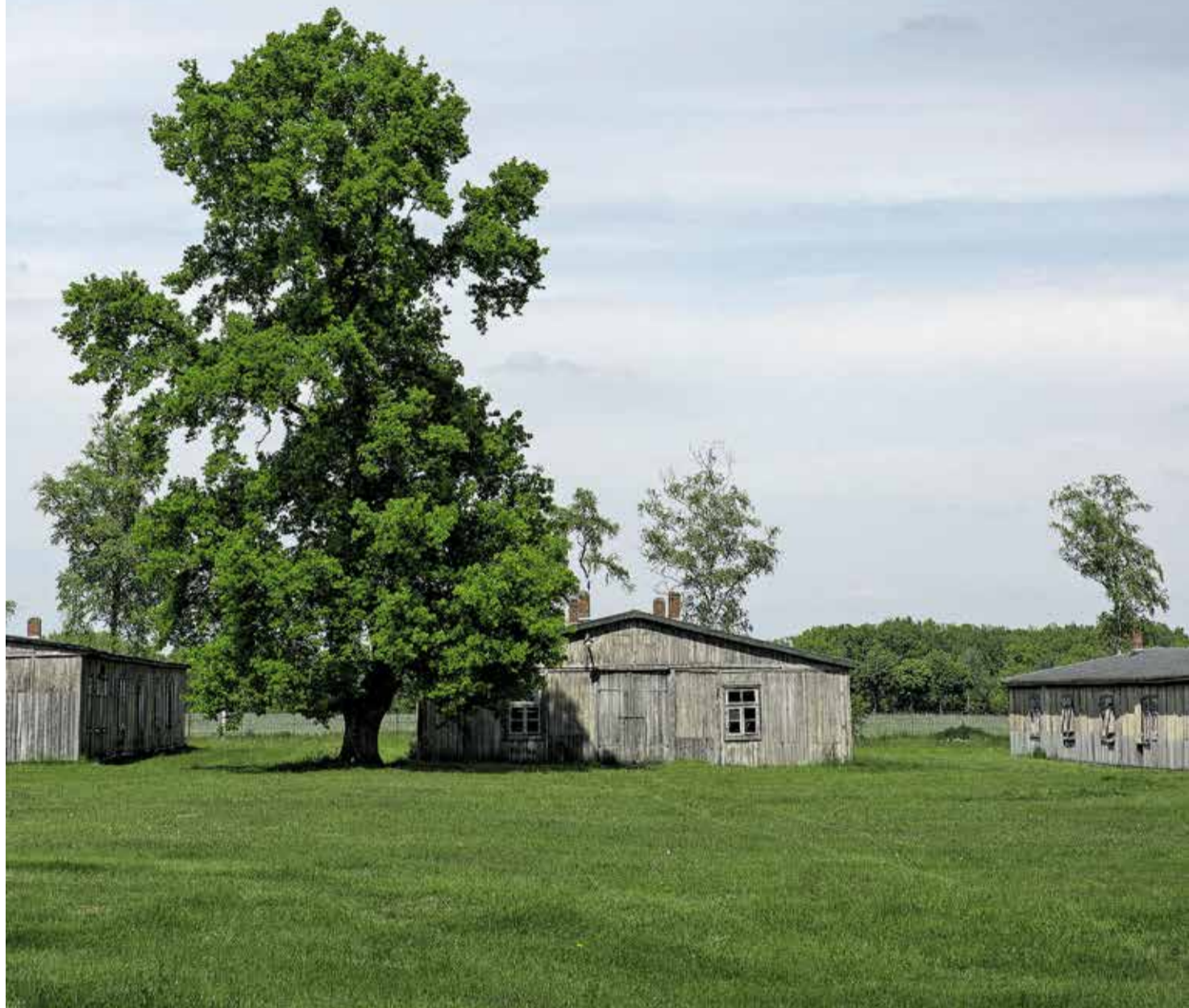
Gedenkstätte Sandbostel in Niedersachsen. Hier stand bis 1945 das Kriegsgefangenenlager Stalag X B. Etwa Zehntausend inhaftierte Rotarmisten starben