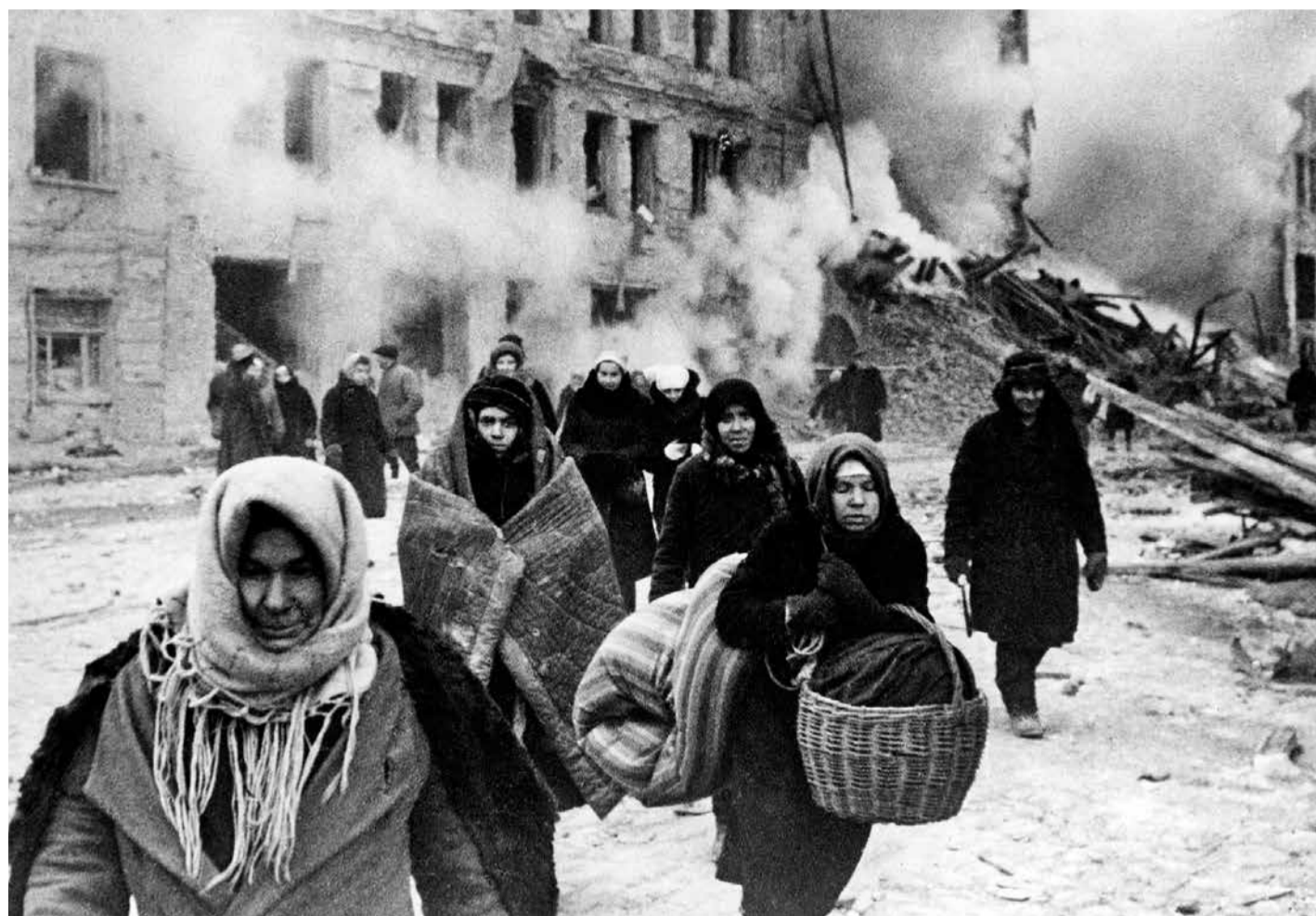
Winter 1941/42: Leningrader*innen flüchten nach einem Bombenangriff. Die Belagerung der Stadt wird noch bis 1944 dauern

Ingo Schulze , geboren 1962 in Dresden, debütierte 1995 mit „33 Augenblicke des Glücks“; 2020: „Die rechtschaffenen Mörder“.