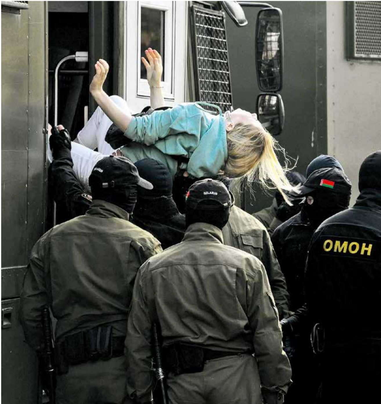
Verhaftungen beim Protestmarsch der Frauen in Minsk am 12. September 2020

taz: Herr Filipenko, in Ihrem Roman „Rote Kreuze“ spielt die Auseinandersetzung mit dem Stalinismus eine wichtige Rolle. Das gilt auch für Ihr neues Buch über den Direktor eines Moskauer Krematoriums. Woher kommt dieses historische Interesse?