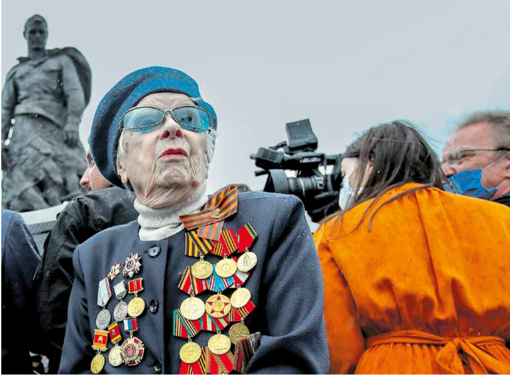
Eine Weltkriegsveteranin bei der Einweihungszeremonie des neuen Soldatendenkmals in Rschew