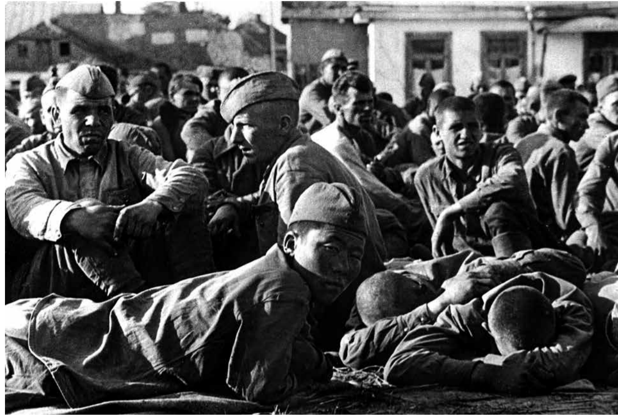
Anfang Juli 1941: Sowjetische Kriegsgefangene an einer Sammelstelle der Wehrmacht, vermutlich in Belarus, der Fotograf ist unbekannt. Derzeit erinnert eine Ausstellung in Berlin-Karlschorst an das Schicksal von sowjetischen Gefangenen; siehe Seite 5

Auf den Straßen von Kiew und Kursk sah man damals noch die vom Krieg verstümmelten, auf ihren hölzernen Wägelchen