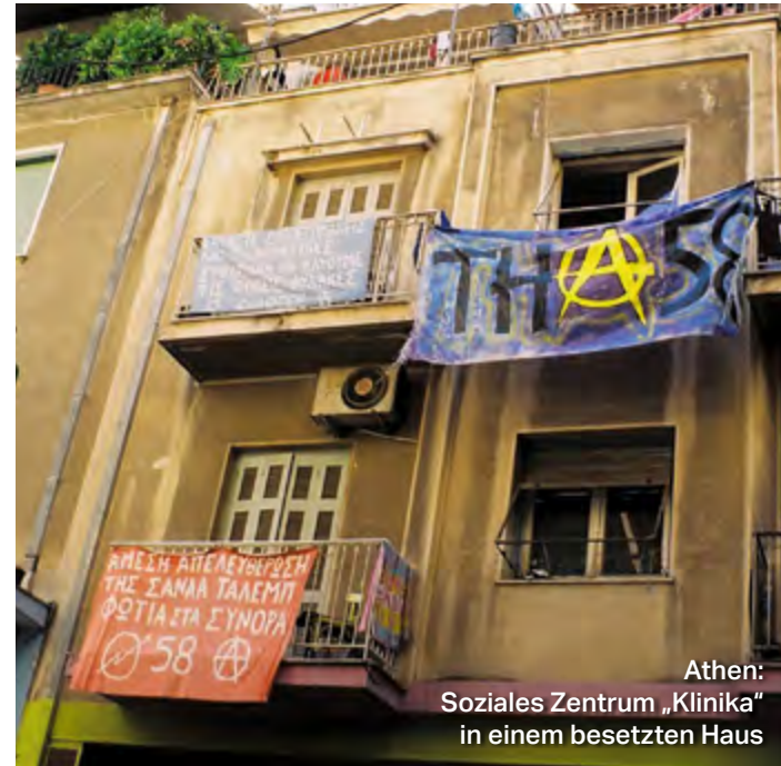
Athen: Soziales Zentrum „Klinika“ in einem besetzten Haus

Wir besuchen u. a.: in Palermo die Anti-Mafia-Bewegung „ Addiopizzo “, die multikulturelle Altstadt sowie das Normannenschloss Monreale • die NGO „ Borderline Europe-Sicilia “ • bei Corleone eine Landwirtschaftskooperative auf Feldern, die von Mafiosi beschlagnahmt wurden 25. Mai – 1. Juni 2019, 8 Tage, ab 1.490 € (DZ/HP/ohne Anreise) RV: via cultus Studienreisen, Stutensee