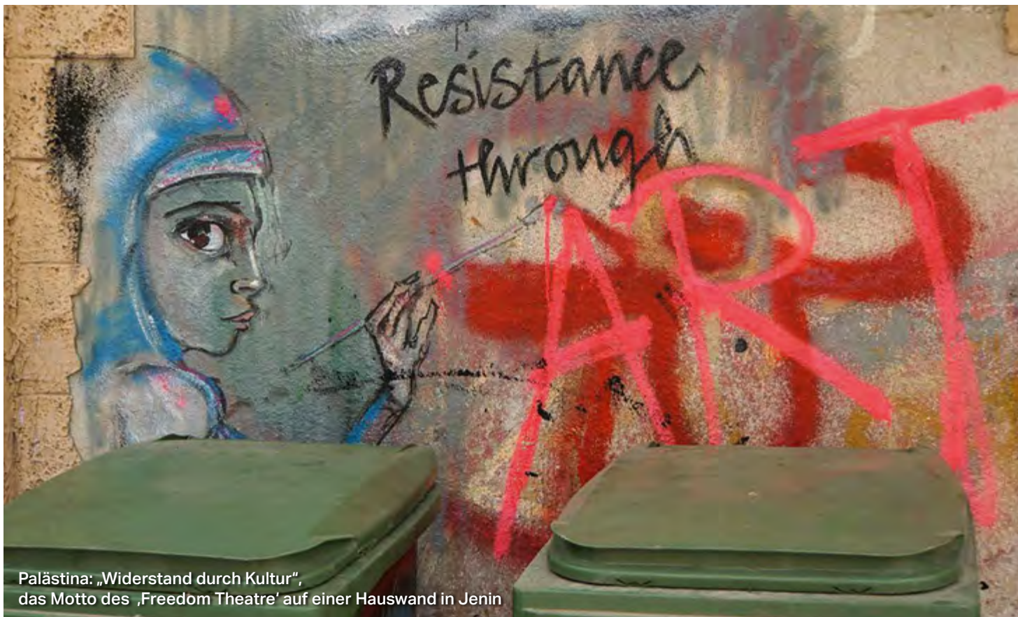
Palästina: „Widerstand durch Kultur“, das Motto des ‚Freedom Theatre‘ auf einer Hauswand in Jenin

In diesem Jahr waren einige Reisen sehr früh ausgebucht. Geplant ist, dass wir sie auch im kommenden Jahr wieder anbieten. Wenn Sie 2020 dabei sein möchten, empfehlen wir, sich frühzeitig und unverbindlich beim jeweiligen Reiseveranstalter vormerken zu lassen. Ab September 2019 finden Sie unsere Programmvorschau für kommendes Jahr mit allen Reisen und Terminen unter www.taz.de/tazreisen .