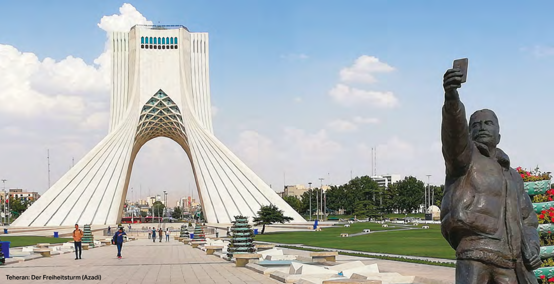
Teheran: Der Freiheitsturm (Azadi)