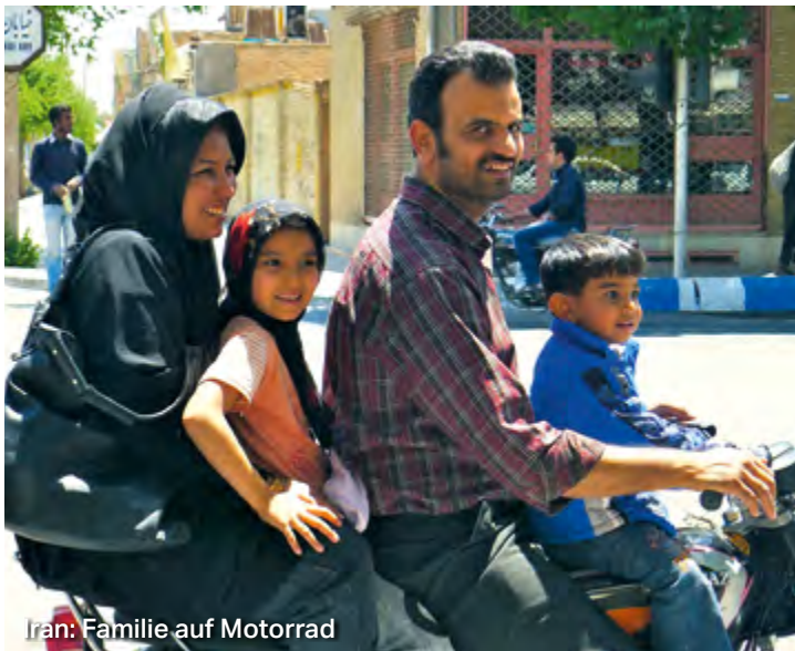
Iran: Familie auf Motorrad

19. Oktober – 2. November 2019, 15 Tage ab 3.170 € (DZ/VP/Flug)