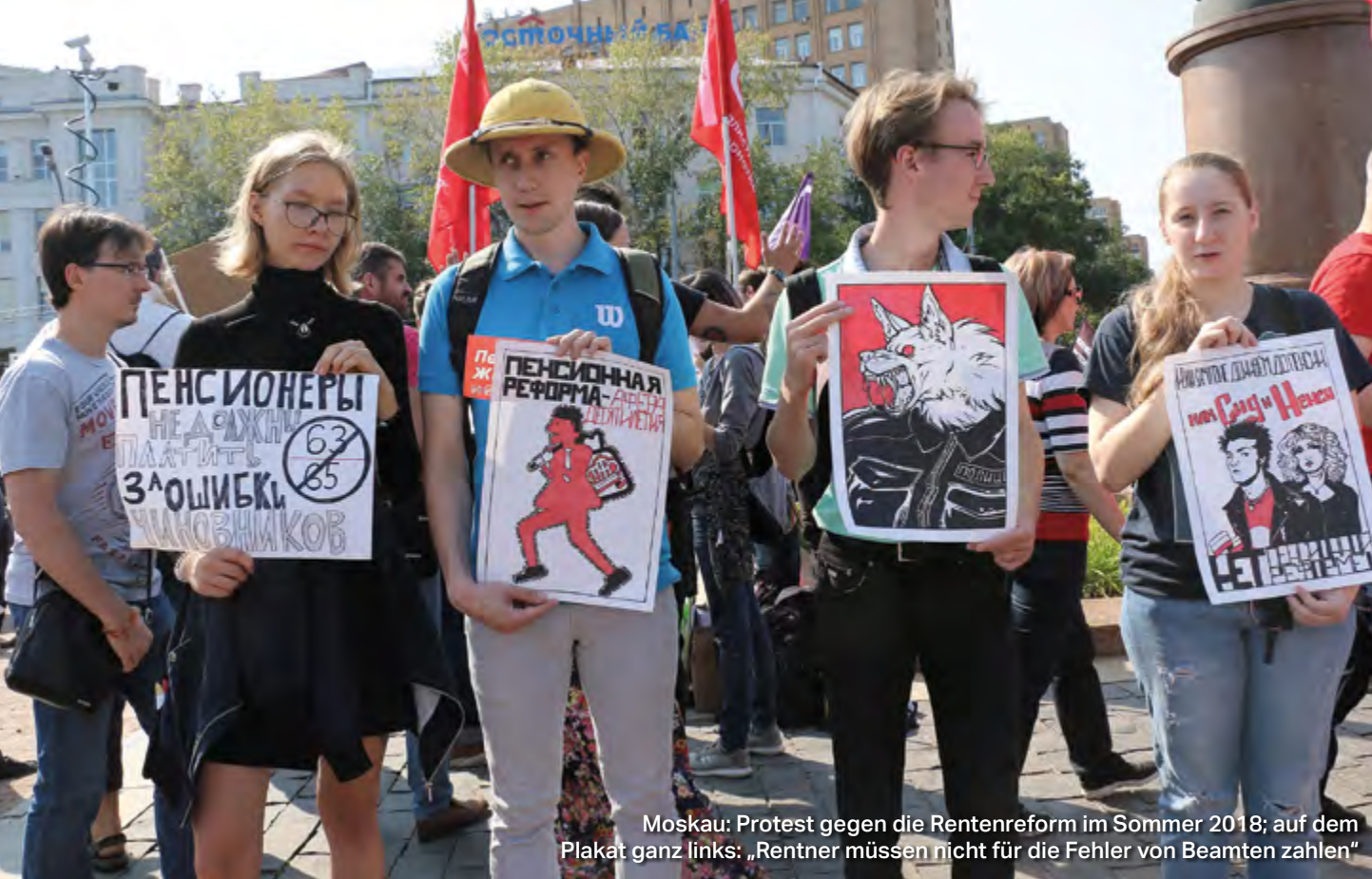
Moskau: Protest gegen die Rentenreform im Sommer 2018; auf dem Plakat ganz links: „Rentner müssen nicht für die Fehler von Beamten zahlen“